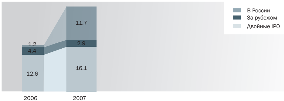
Объем размещений, $ млрд.

Если в 2006 году до 90% объемов размещений приходилось на «двойные размещения» и размещения, проводимые только на западных площадках, то в 2007 году примерно 41% объемов размещений было осуществлено исключительно на российских площадках.